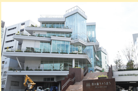
▲本の森ちゅうおう