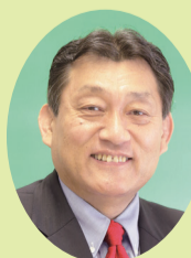
区議会議長 木村かついち