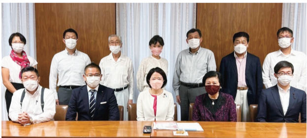
▲夏の政調会 講師：内閣府大臣政務官(こども家庭庁担当) 自見はなこ参議院議員