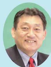
区議会議長 木村かついち